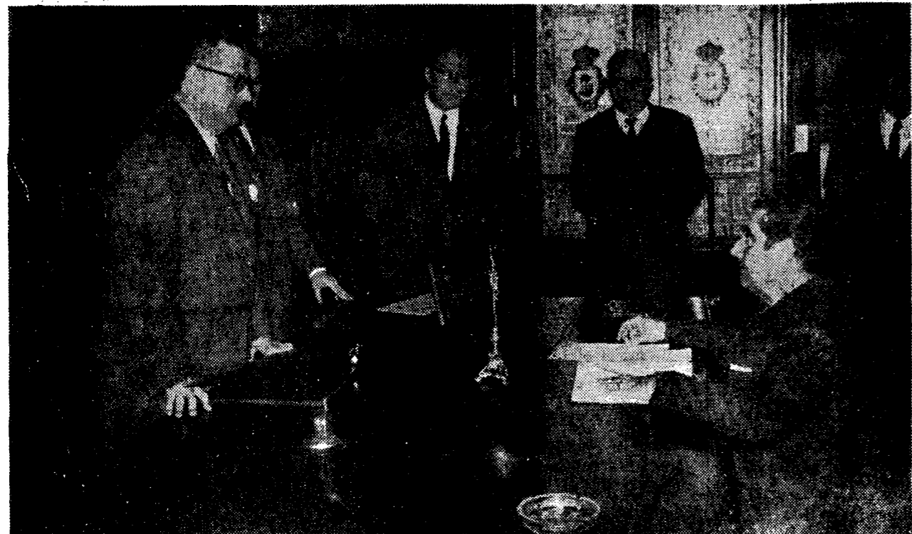
Al mediodía de ayer el Gobernador civil y Jefe provincial del Movimiento, don Juan Alfaro Alfaro, dio posesión de su cargo al nuevo alcalde y jefe local de Ayamonte, don Antonio Concepción Jiménez. La fotografía recoge el momento de la jura del mismo.—(Información en última página).