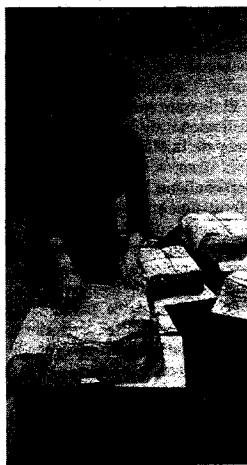
ARCHIVO DE NIEBLA.

Los fondos documentales de un archivo se mantendrán ordenados en diferentes etapas, de acuerdo con los principios de archivísticas. El profesional encargado de la organización del archivo aplicará los principios y técnicas modernas de valoración para, transcurrido un tiempo, seleccionar los documentos que por su valor van a ser conservados indefinidamente.