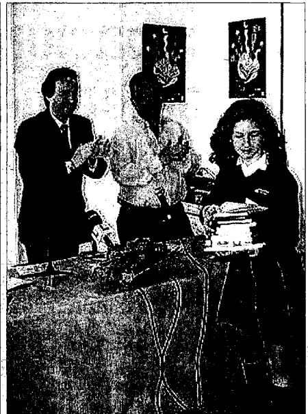
PLAZA DE LAS MONJAS. Presentación de la obra 'Glorioso triunfo del príncipe Arjuna', de Francisco Ayala. Una niña recoge el premio del concurso literario sobre Juan Ramón.