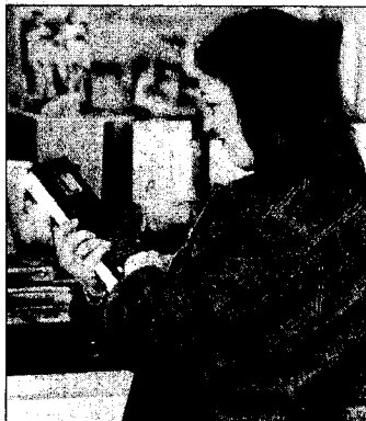
Una lectora ojea un libro en un puesto.