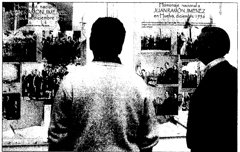
Varios visitantes observan los paneles de la exposición fotográfica sobre Juan Ramón Jiménez.