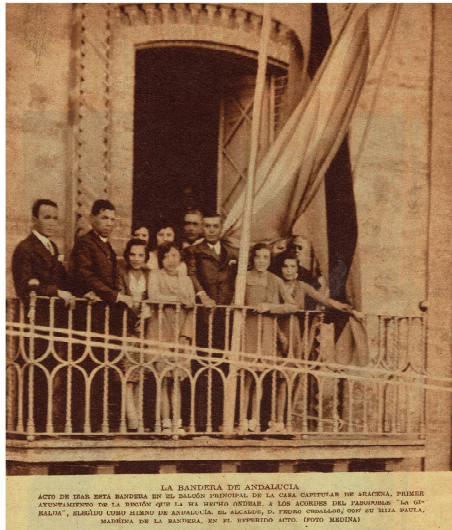
Izado de la Bandera en Aracena (3 de Diciembre)

IZADO EN MADRID EN LA CASA CENTRAL DE ANDALUCÍA