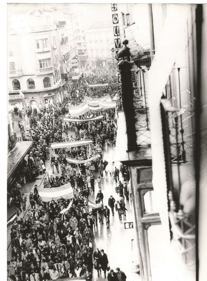
Manifestación en Granada 4 diciembre 1977