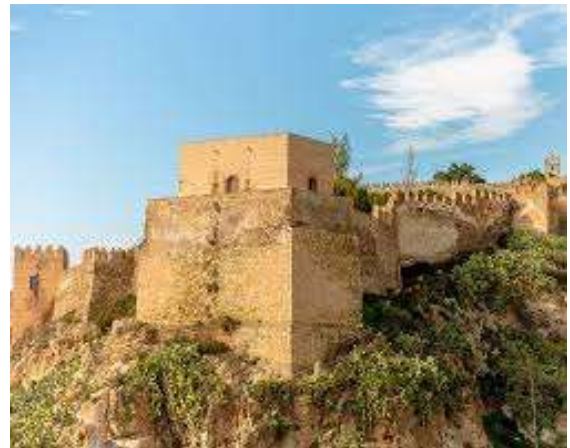
Alcazaba de Almería

Blas Infante , expone el significado de la misma: “Verde es la vestidura de nuestras sierras y campiñas, prendidas por los broches de las campesinas habitaciones blanca; limoneros en flor son los árboles preferidos por los andaluces y blancas son nuestras villas y antiguas ciudades de blancos caseríos con verdes rejerías orladas de jazmines. Pura y blanca como un niño, es la Andalucía renaciente que en nuestro regazo se calienta”