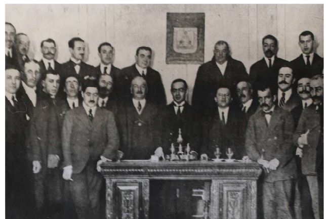
Mesa de la Asamblea Autonomista de Ronda, de 1918, presidida por Blas Infante.