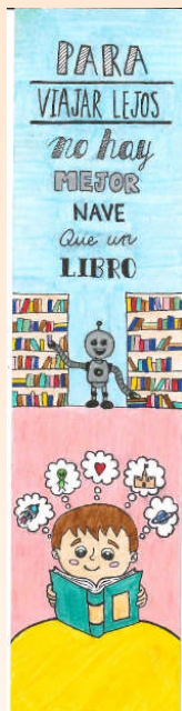
Categoría Juvenil Blanca Serrano Prior