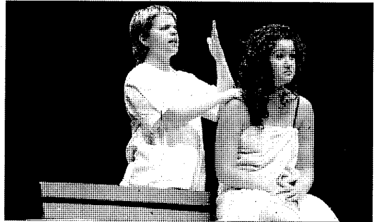
Representación, anoche, de 'Locas concesiones'.

El Ayuntamiento ya tiene abierto el plazo para la presentación de inscripciones para el programa de Cultura en los Barrios del próximo curso y que arrancará en octubre.