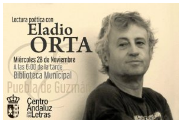
Cartel de la cita.

onubense ha dejado su bicicleta voladora aparcada en la Biblioteca de La Puebla, lugar en el que ha compartido gran parte de sus poemas. Una iniciativa del Ayuntamiento de Puebla de Guzmán y del Centro Andaluz de las