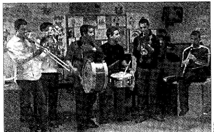
PEDIATRÍA. Actuación ofrecida en el centro hospitalario.

Asimismo, manifestó que con iniciativas como la desarrolladas en el Hospital Juan Ramón Jiménez "queremos poner nuestro granito de arena no sólo en Moguer, sino también fuera de nuestra localidad, para, en este caso, sacarle una sonrisa a los niños a través de la música".