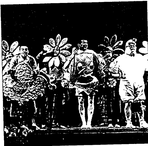
Una de las actuaciones de la edición pasada del Carnaval de Isla.