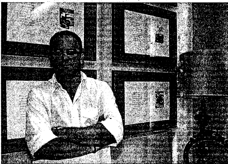
RECOPILACIÓN: Unos 350 autores de Huelva y provincia están recogidos en este manual.

Stabile incidió en que esta obra, que "no está acotada ni en el prin-