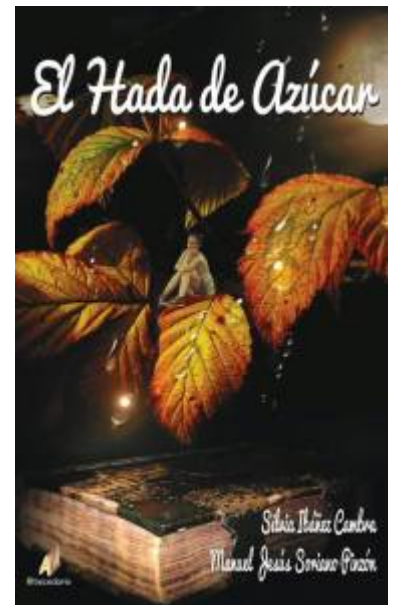
Portada de la novela 'El hada de azúcar'