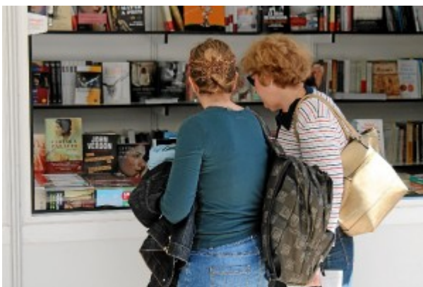
Feria del Libro de Huelva.