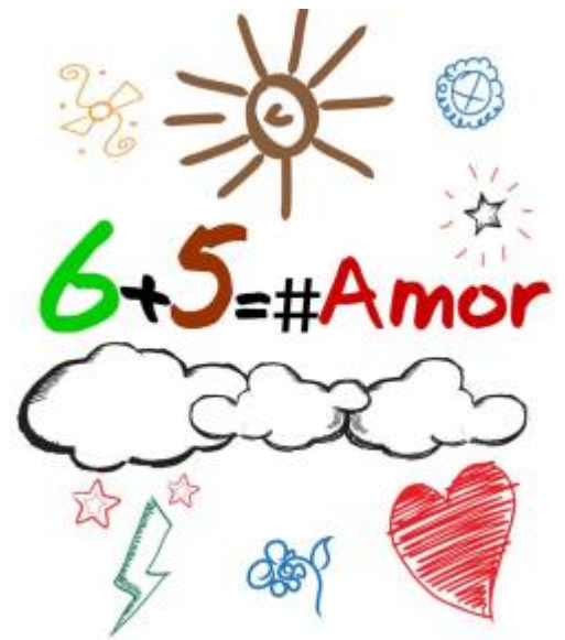
Portada del primer libro de Soriano y Contreras.

Sinopsis de la obra. El lugar elegido como escenario para esta novela es El Rompido, tenido como escenario su faro, que es el punto de partida y la base de esta obra romántica manchada con tintes dramáticos, poéticos y crueles... Una novela que narra una historia de amor contada por un octogenario