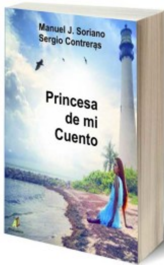
Imagen del libro.

al amor de su vida , que en el ocaso de su existencia le revela por última vez cómo se enamoraron en su adolescencia y los tragos que la vida da muchas veces para que los sentimientos nunca sean correspondidos como uno quisiera.