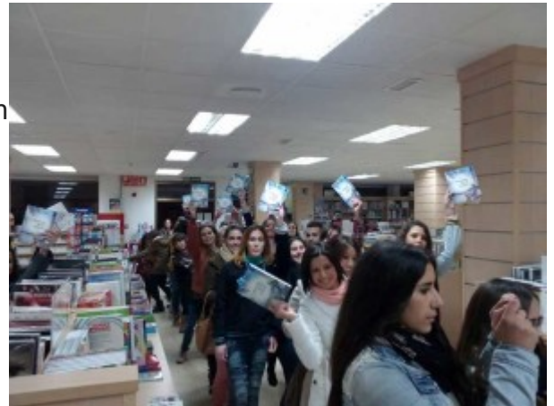
Colas en la firma de ejemplares en Córdoba.

olvido no se instale entre sus viejos ladrillos solapados por las golondrinas que surcan la bahía de dulce sabor a mar.