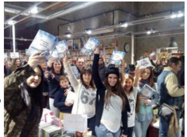
Las firmas de libros están siendo un éxito. En la imagen, Jerez.