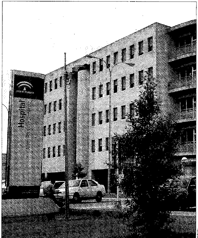
40 MÉDICOS. El Juan Ramón Jiménez acoge a los residentes.

Como novedades, esta etapa formativa estará guiada por los nuevos programas docentes recientemente revisados a nivel nacional en la mayoría de las especialidades.