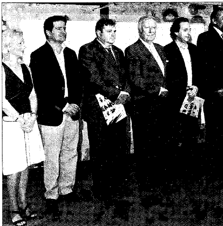
Representantes institucionales en la presentación de OCIB 2009.

Con especial importancia, además del Salón del Libro Iberoamericano, germen de la iniciativa, en ésta se desarrollará el Congreso Iberoamericano de Fundaciones para la Cooperación, que aportará la nota más solidaria a este evento cultural, donde también estará presente México, invitado de honor de la primera y anterior edición.