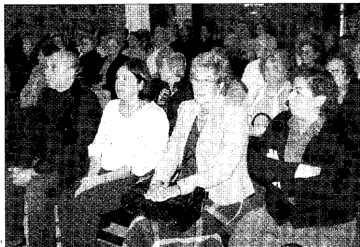
LA OFRENDA. Algunas de las personas que asistieron al acto.

La mayoría de los colectivos que participaron en la ofrenda floral pertenecen al Consejo Local de Mayores.