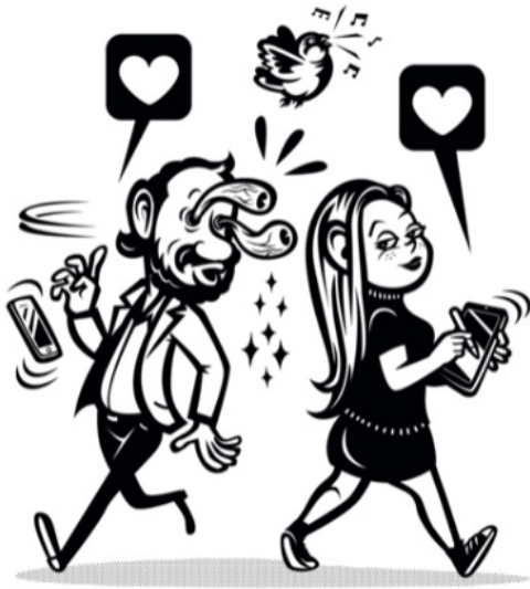
CAPÍTULO 14 - El Trocho se enamora

Igualmente, desde hace unos años colabora asiduamente con Marcos Gualda en multitud de proyectos y ocurrencias culturales. Sea este libro un ejemplo de ello.