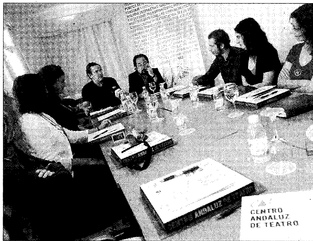
Los participantes del foro durante el primer encuentro que mantuvieron ayer en la UNIA.

Además, Molina añadió que «en relación a hace 25 años, ha habido una explosión impresionante, y señal de ello es el número de compañías y de teatros que hay».